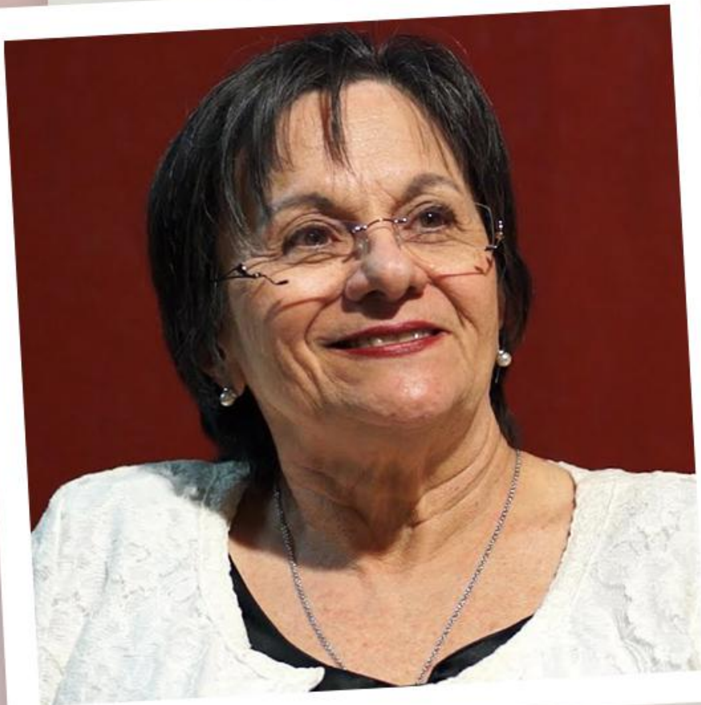
Maria da Penha