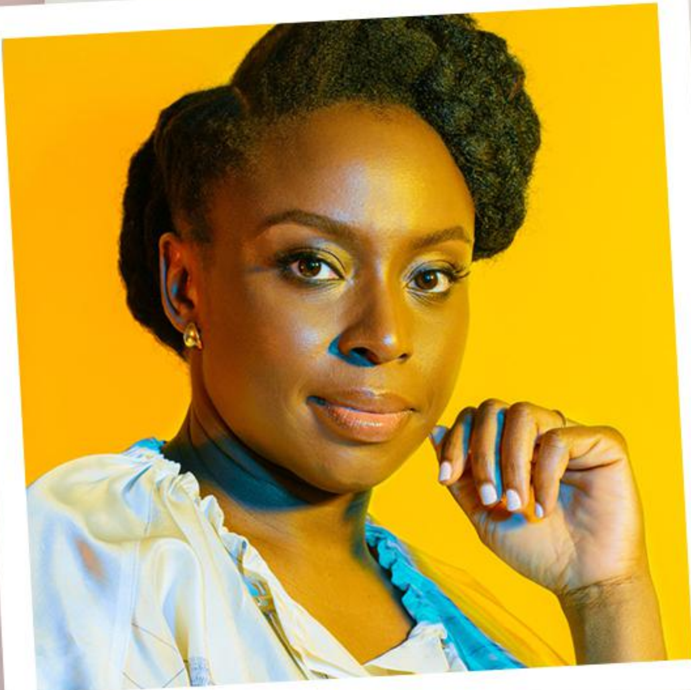
Chimamanda Ngozi Adichie